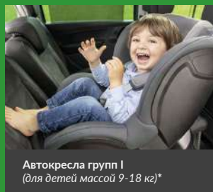
Автокресла групп I (для детей массой 9-18 кг)*