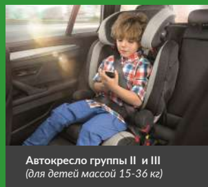
Автокресло группы II и III (для детей массой 15-36 кг)