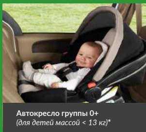
Автокресло группы 0+ (для детей массой < 13 кг)*